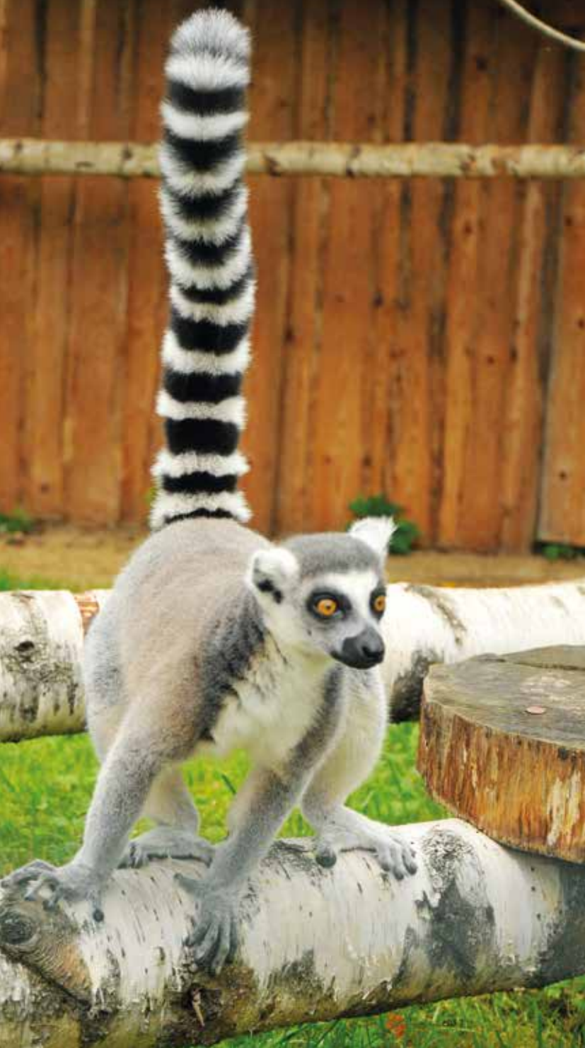
Spišská Nová Ves ZOO – Lemur